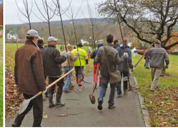
Nach dem Fassen von Baum und Schaufel marschieren die Baumpatinnen und Baumpaten los zum ausgesteckten Obstgarten.