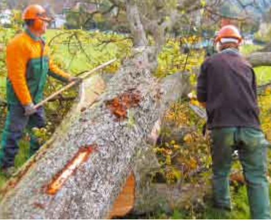
Mitarbeitende des Juchhofs beim Roden der alten Bäume.